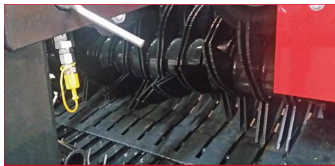
El modelo RB 120 Rotor tiene de serie el alimentador con rotor. The RB 120 Rotor model is equipped with rotor feeder system.