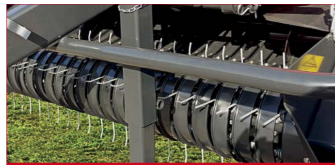
El modelo RB 120 tiene de serie el alimentador con horquilla. The RB 120 model is equipped with rake feeder.